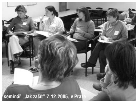
seminář „Jak začít“ 7.12.2005, v Praze

Projekt Profesionalizace Sítě, podpořený právě tímto programem z prostředků Ministerstva práce a sociálních věcí ČR (MPSV) umožnil vznik tří nových pracovních míst pro výkonný tým a administrativní sílu. Zkvalitnila se tak jejich práce v komunikaci s MC, v oblasti podpory jejich rozvoje, pomoci, poradenství (zejména formou e-learningu), vzdělávání, podpory vzniku nových MC, koordinace společných akcí, společné PR a lobby na celorepublikové úrovni. 7.12.2005 uspořádala Síť seminář pro začínající mateřská centra s názvem „Jak začít“, kde se účastníci dozvěděli informace o zakládání MC, o fundraisingu, komunikaci v MC. Samozřejmě bylo zajištěno hlídání pro děti.